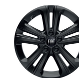
Obręcze kół 16"