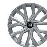
Kołpaki felg stalowych