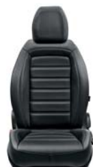
404 Skóra ekologiczna czarna