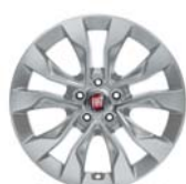
Obręcze ze stopów lekkich 16"