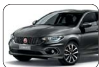
695 Szary Colosseo (metalizowany)