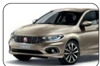
722 Perłowy Sabbia (metalizowany)