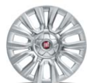
Obręcze stalowe 15" z kółkami