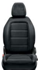
314 Tkanina czarna