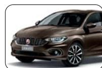
444 Brązowy Magnético (metalizowany)