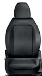
879 Materiałowo-skórzana czarna