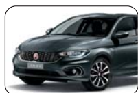
793 Szary Street (pastelowy)