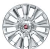
Obręcze stalowe 16" z kółkami