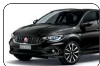
718 Czarny Cinema (metalizowany)