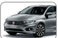
612 Szary Maestro (metalizowany)