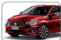
716 Czerwony Amore (metalizowany)