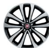
Obręcze ze stopów lekkich 17"