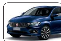
717 Niebieski Mediterraneo (metalizowany)