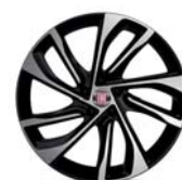
Obręcze ze stopów lekkich 18"