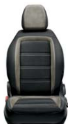
301 Tkanina ciemnoszara z jasnymi wstawkami