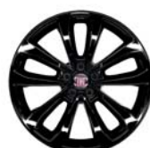
Obręcze ze stopów lekkich 17"