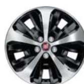
Obręcze ze stopów lekkich 16" tylko dla pakietu ECO