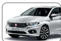
249 Biały Gelato (pastelowy)