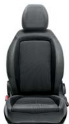
015 Tkanina czarno - szara