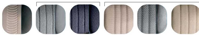
230 Tapicerka Iris 157 Tapicerka Flocker Szara 182 Tapicerka Flocker Niebieska 852 Tapicerka Ghibli 233 Tapicerka London Szara 409 Tapicerka Ghibli skórzana (211)

Cennik zawiera ceny detaliczne w złotych z VAT. Ceny zawierają podatek akcyzowy. Ceny mogą ulec zmianom bez uprzedniego zawiadomienia w przypadku zmian cen przez producenta, zmian podatkowych, przepisów celnych lub innych przyczyn. Wyposażenie seryjne i dodatkowe poszczególnych modeli może ulegać zmianom w zależności od potrzeb poszczególnych rynków i wymogów prawnych. Dane w niniejszym cenniku mają charakter orientacyjny i nie stanowią oferty w rozumieniu Kodeksu Cywilnego. Data aktualizacji: 20.05.2010